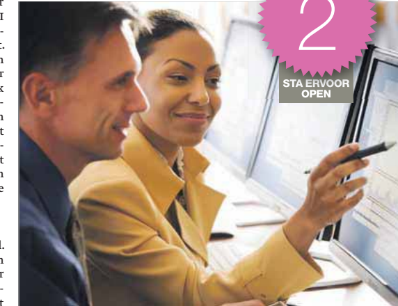
SOFTWARE. Business Intelligence ligt steeds meer in het bereik van het mkb. Dit heeft voor een deel te maken met het feit dat de software hiervoor simpelweg niet meer zo duur is als vroeger.