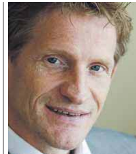
Theo Rinsema Directeur Microsoft Nederland

IT-specialisten op de achtergrond Door de ontwikkeling van cloud computing komen geavanceerde software-oplossingen binnen het bereik van kleine bedrijven. Systemen nemen qua complexiteit steeds meer toe, maar door ze terug te 'duwen' in de cloud kan deze complexiteit be-